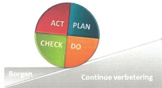
Figuur 1: Cirkel van Deming

Om te waarborgen dat de communicatie m.b.t. CO 2 -beleid van het bedrijf hun doel(en) bereiken is een efficiënte stuurcyclus noodzakelijk. Hieronder zijn de stappen omschreven die bij Siemens Beheer BV en haar werkmaatschappijen gevolgd worden om dit te realiseren. De stappen zijn gebaseerd op de Deming cyclus: Plan-Do-Check-Act. Deze stuurcyclus is geïmplementeerd en geborgd middels procedure C 8.8 van ons handboek van het managementsysteem voor CO 2 -bewust handelen.